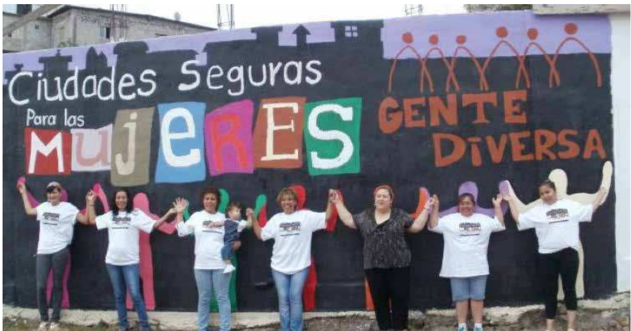
Huella de Intervención durante el proyecto Ciudades Seguras para las Mujeres 2011. Colonia Sánchez Taboada. Tijuana, Baja California.

de género y los planteamientos más actuales en seguridad ciudadana y en simultáneo, generar procesos de participación de las mujeres en el diseño del espacio, que permitan capitalizar su experiencia en aquellos temas vividos muy de cerca, tales como la seguridad, el cuidado, la educación, el transporte público, la vivienda, los equipamientos y servicios urbanos. Ello supone colocar en el debate el tema seguridad-inseguridad, temores y vivencias desde una óptica más amplia y hacerlo en el marco de los derechos humanos de las personas. La prevención más que la punición y específicamente, en la promoción del derecho de las mujeres a vivir y disfrutar de las ciudades y al ejercicio de su ciudadanía plena. Por ello, la participación de las mujeres resulta fundamental, porque así se convierten en sujetas, protagonistas de la intervención y partícipes de la acción.